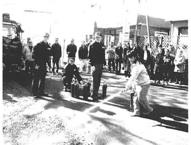
私にだって火は消すこと出来るわよ・・・