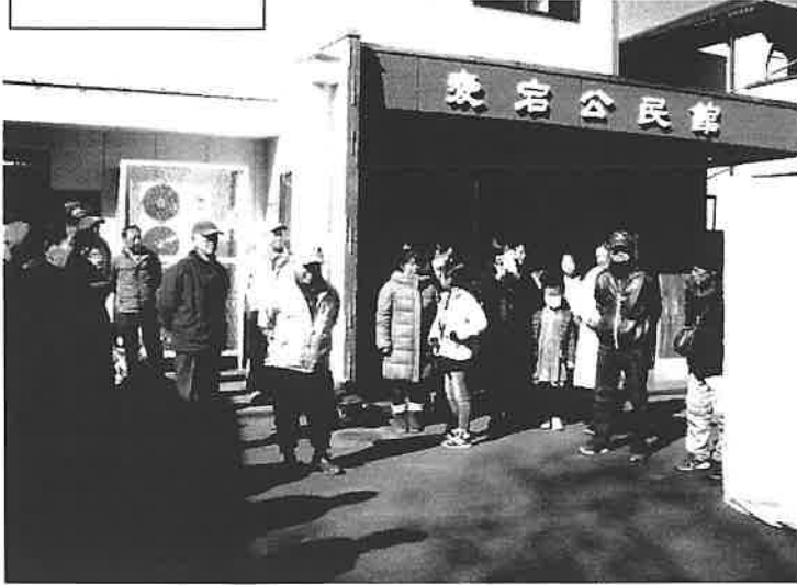
煙体験・するぞう・・・