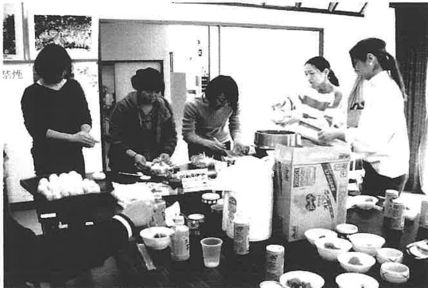
子供会の皆さん・おにぎり沢山にぎって頂き ありがとうございました。