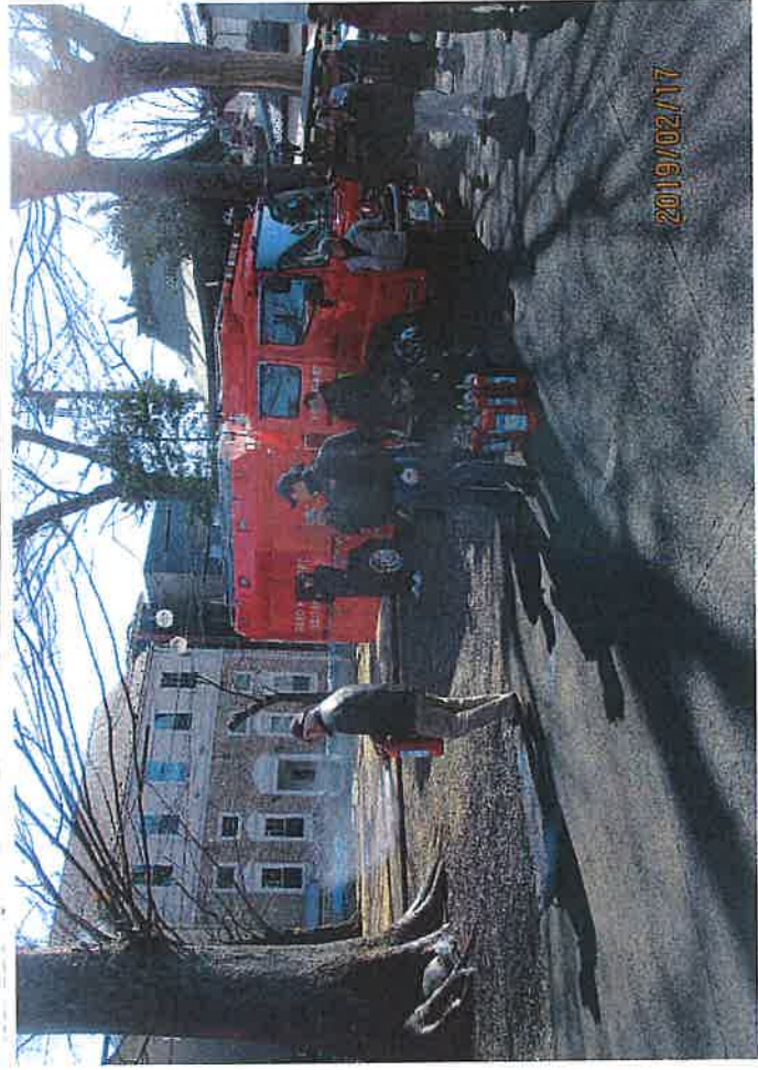
愛宕3丁目自衛消防部 消火器訓練