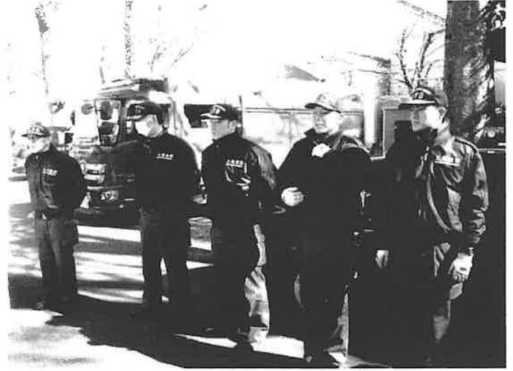
大谷分室署員・これから消火訓練を実施します。