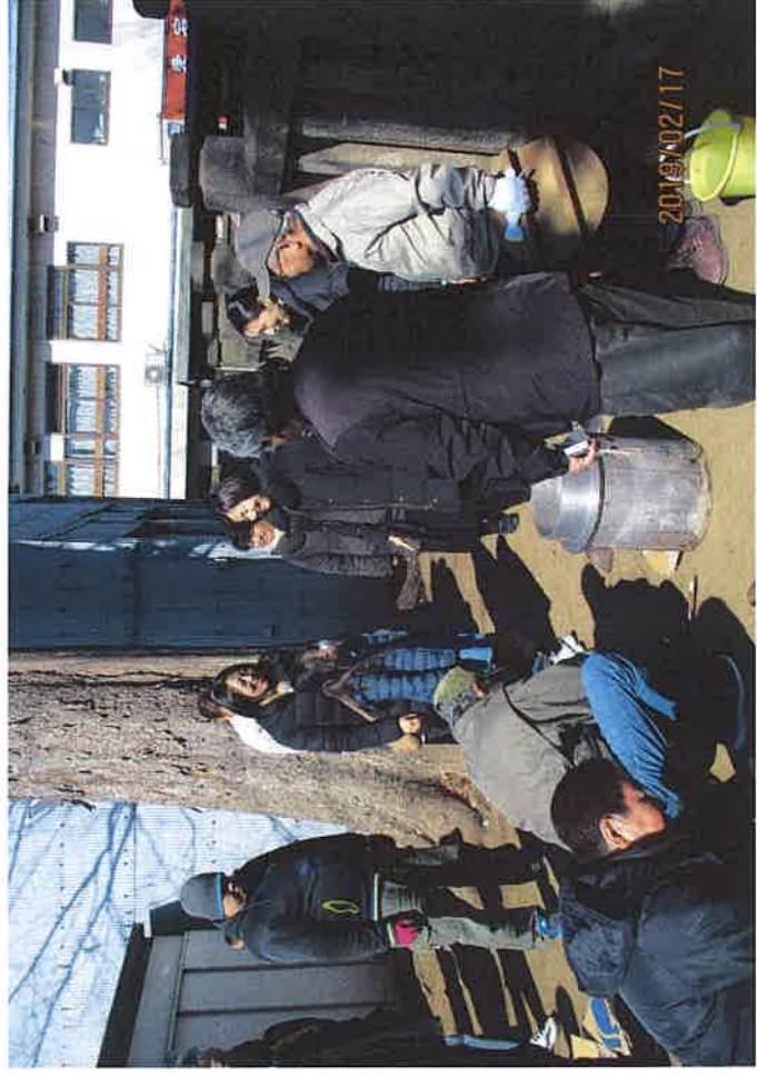
愛宕3丁目自主防災部炊き出し訓練、カニボール紙使用