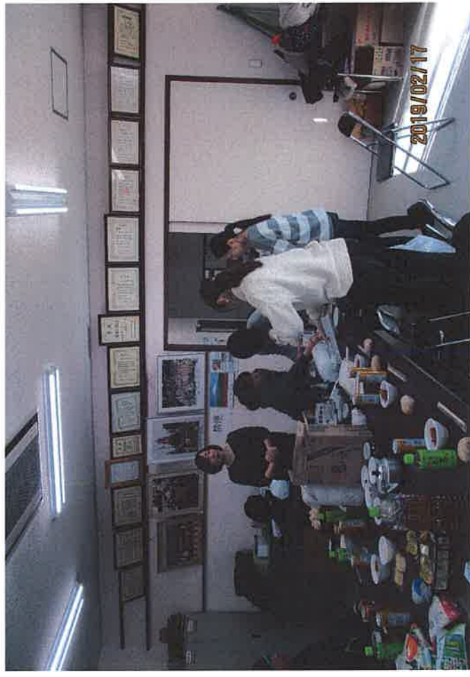
愛宕3丁目自主防犯部炊き出し後食事会