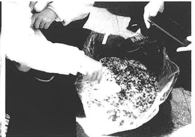
炊出し用アルファ米（五目ご飯） どうやって、作るのかな・・・ お湯を入れるだけで良くできました。