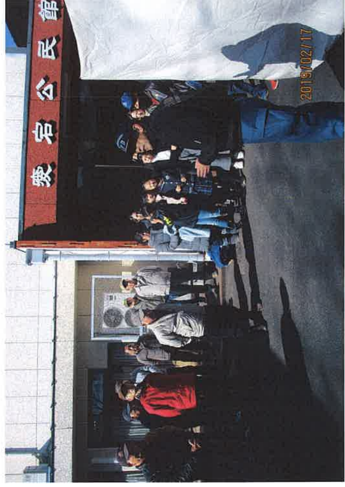
愛宕了丁目自主防災部煙体験