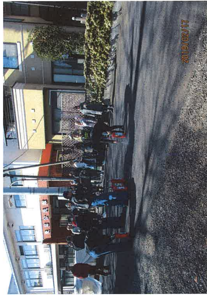
愛宕3丁目自主防災部：消化器訓練