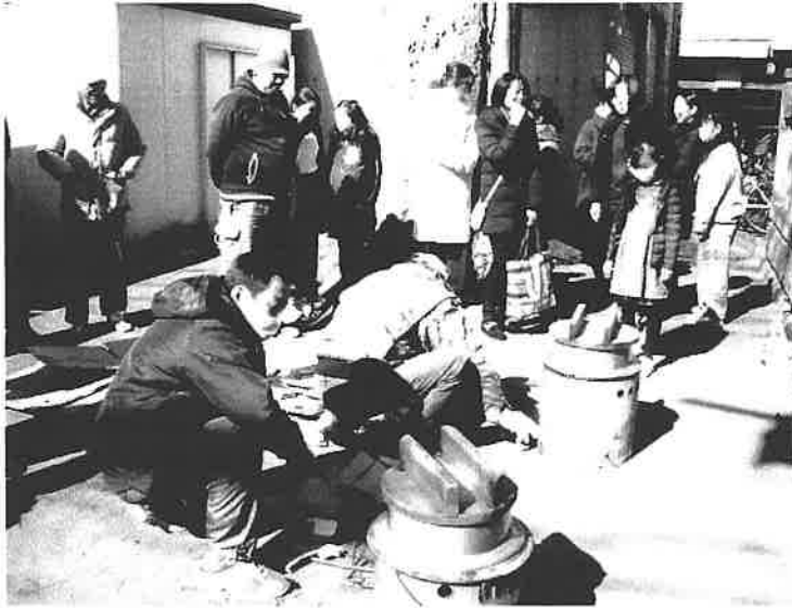
サー 炊出し着火ヨーシ