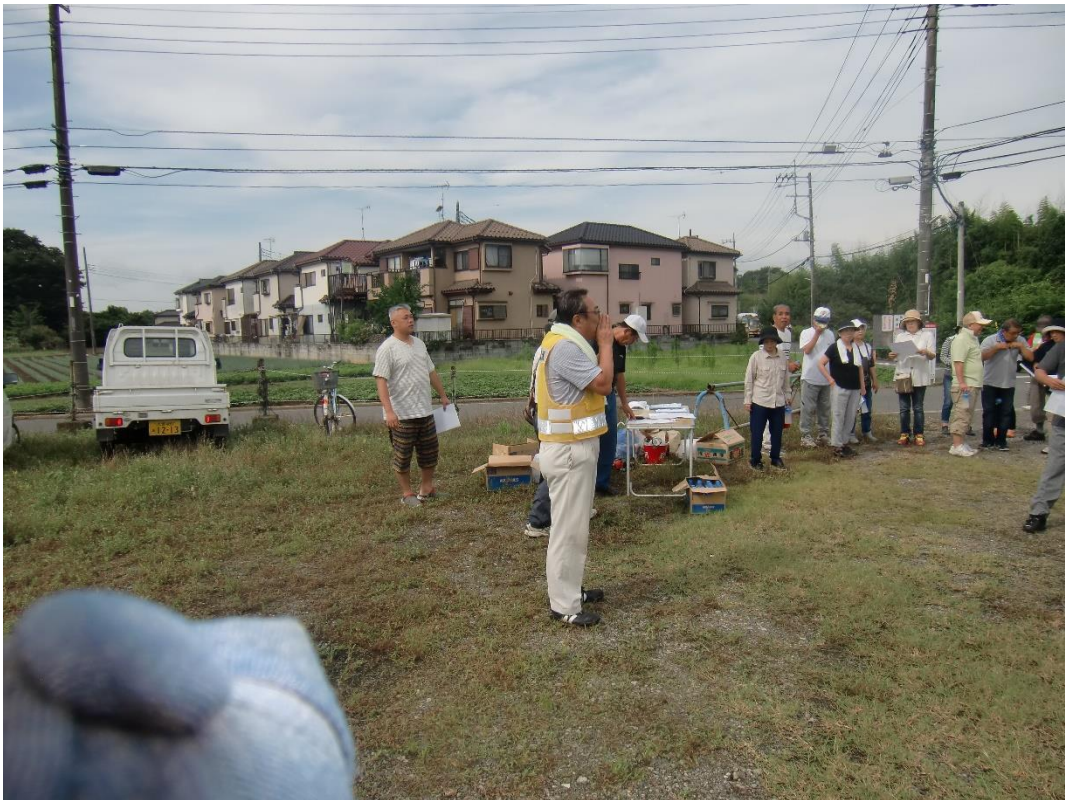
皆さん集まって下さい