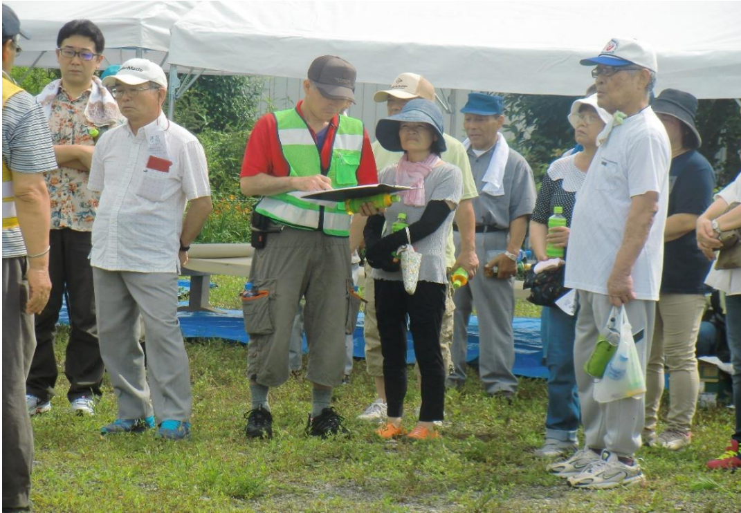
わが家の周辺はどうか？