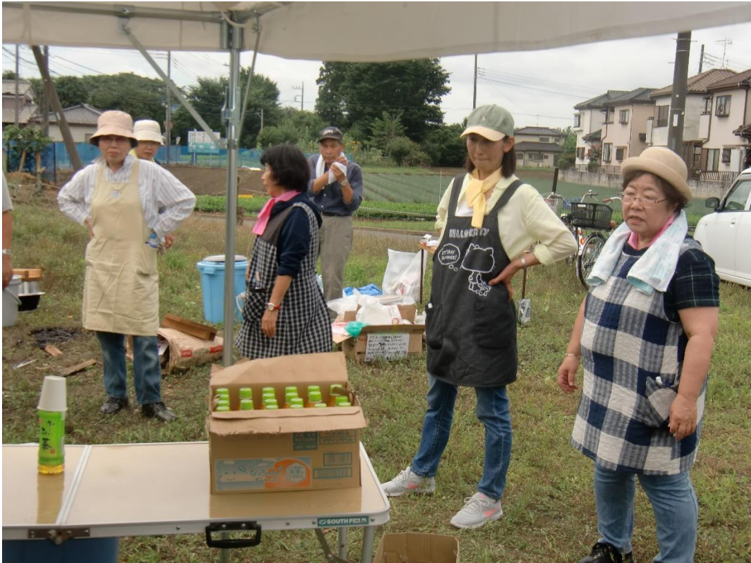
美味しくできたかな？