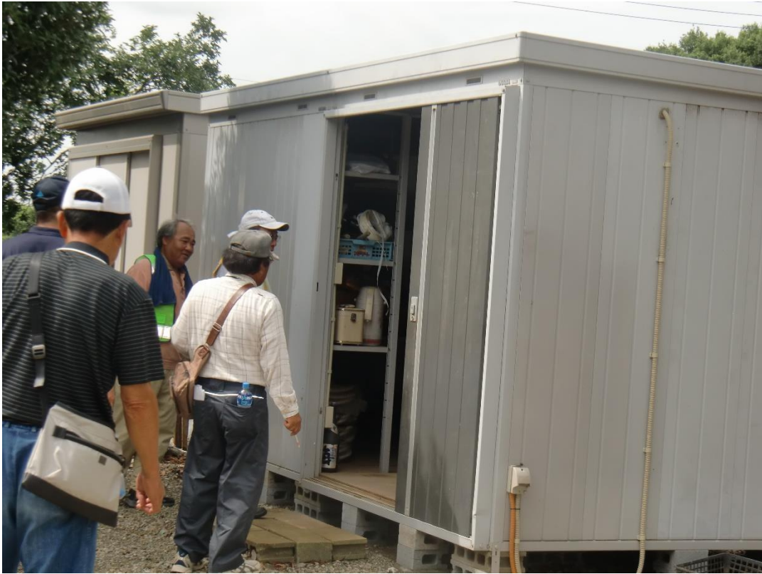
防災倉庫確認 (大井川区長宅)