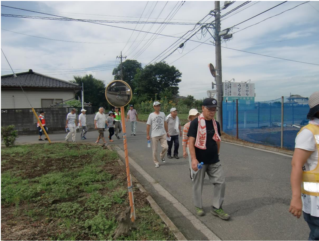
新田区沢山の方が参加されました