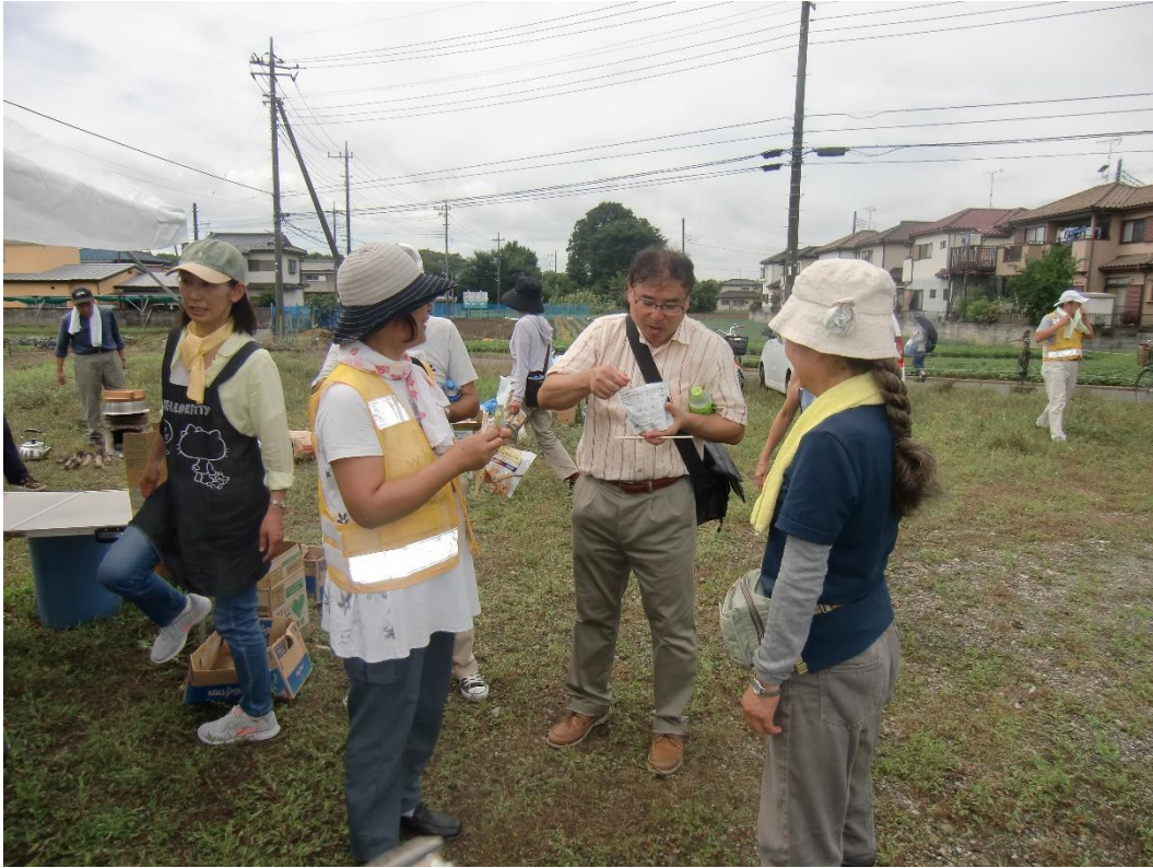
美味しそうに食べてますね～