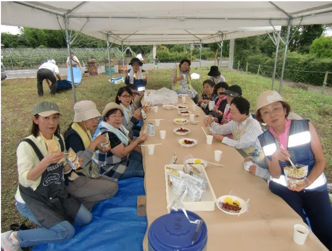
見守り隊の皆さん いつもご苦労様