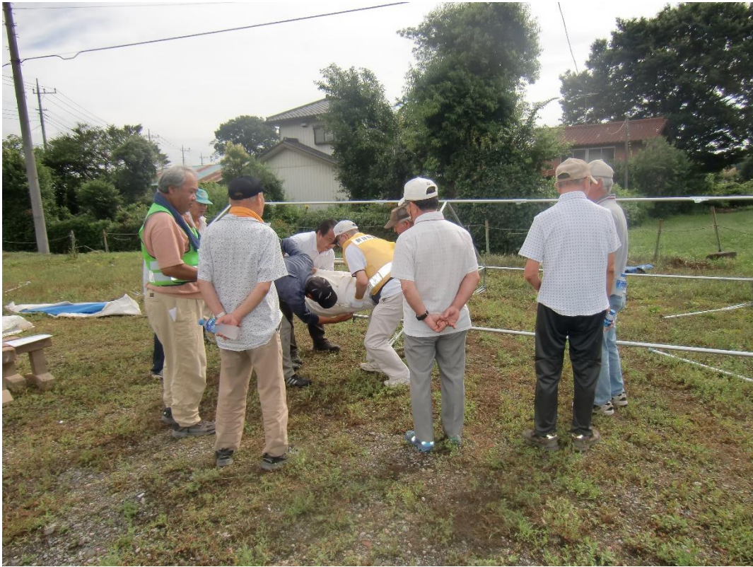
ご苦労様 テント作り