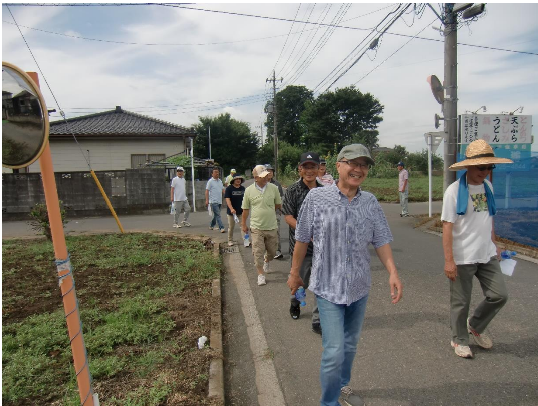
色々発見がありましたね～