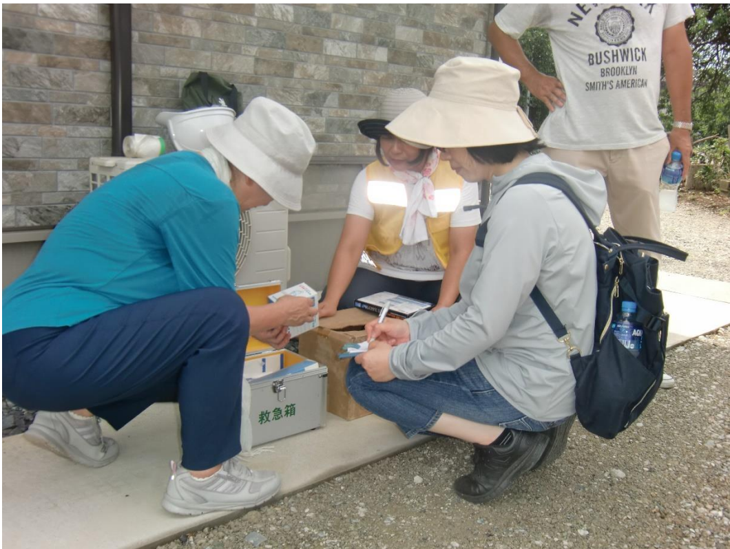
救急箱の確認 失格でした! 期限切れ