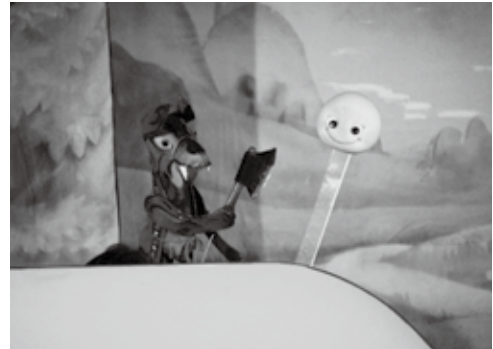
すぎのご芸術文化振興会『おだんごばん』より

昔話『おだんごばん』を、本格的な人形劇で楽しみませんか？ 大きな子ども大歓迎！ 時 3月27日(水) 10:30～11:30 所 文化センター 内 『おだんごばん』の人形劇 【出演】 すぎのご芸術文化振興会 対 市内に在住の4歳～小学生(保護者同伴可) 定 100人(先着順) 申 3月5日(火)から(土)祝を除く10:00～16:00 電話で、子どもの読書活動支援センターへ