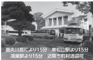
園中央川島ICより15分 東松山駅より15分 鴻巣駅より15分 近隣市町村送迎可

宿泊 研修 ビジネス 宴会 日帰り入浴 サウナ 体育館 テニス フットサル 大駐車場