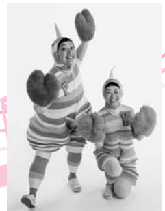
『エビカニクス』で人気のケロポンズ

☎3月17日(日)13時～(開場/12時30分) 所文化センター 内遊ぶうた『エビカニクス』で人気のケロポンズのファミリーコンサート 【出演】ケロポンズ ●チケット販売 ☎1月19日(土)10時からインターネット(☎http://www.ageo-kousya.or.jp/center/)で ※セブン-イレブン、ファミリーマートのマルチコピー機でも販売します。 ※1月21日(月)9時から文化センター窓口でも販売します。 ※売り切れ次第終了です。 ☎一般/2,000円、小学生以下/1,000円、親子ペア/2,800円 ※2歳以下は無料ですが、座席が必要な場合は有料です(全席指定)。