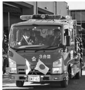
昨年の消防出初式

所市消防本部 内消防車両と消防職・団員の行進、市長の年頭訓示、消防署訓練展示 ☎消防総務課☎775-1150 0・☎775-12230