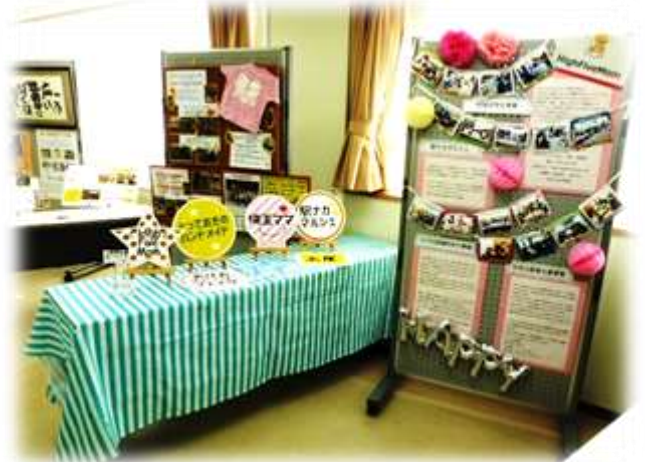
【工夫を凝らした団体パネル】