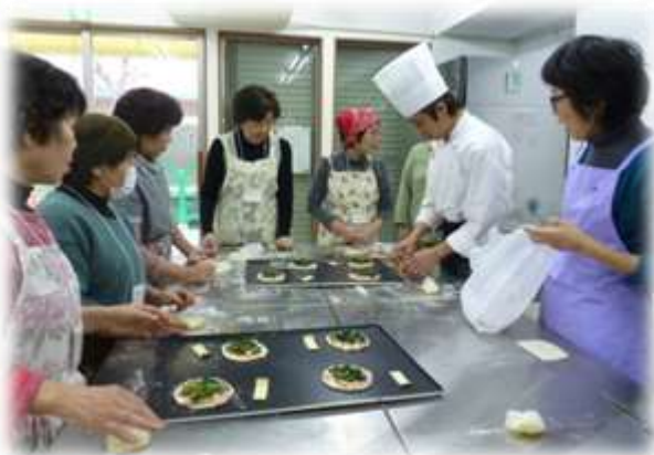
【具だくさんのピザパン作り】

2 月 1 日(木)のプレオープンに伴い、全 5 回にわたって無料のパン教室が開かれました。参加者は、教えてもらいながらパン生地をこねたり叩いたり、中身のあんこを包んだりした後、パン工房の本格的な製パン機で焼き上げたパンの香りにうっとりし、試食のパンに舌鼓を打っていました。