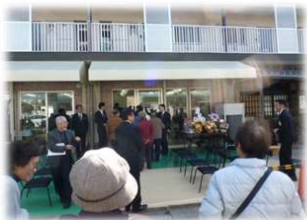
【オープンを心待ちにしていた地域の方々】

3 月 3 日には、オープンセレモニーにあわせて「上尾富士見団地における団地活性化に関する協定書」締結式が行われ、上尾市長、埼玉県住宅供給公社副理事長、富士見団地事務区長、あらぐさ福祉会理事長の 4 者が協定書に署名をしました。