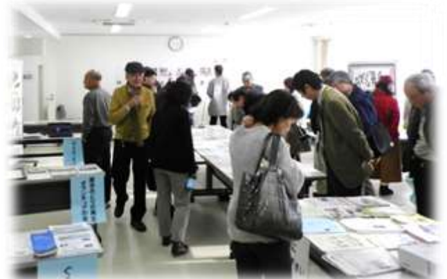
【展示室のパネルや資料を見学する人たち】