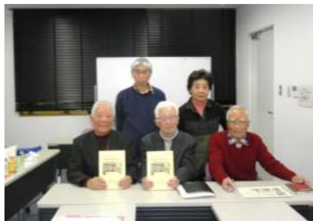
【平成 29 年 8 月発行の冊子を手に】

昨年 8 月 15 日、冊子『わがまち 上尾を知ろう 上尾の戦中・戦後のすがた』を発行しました。市立、県立図書館に足を運び、膨大な市史や統計と向き合って発行まで 2 年を費やした労作。回想記は、市民からの寄稿や市内小中学校の記念誌から転載したもので、当時の暮らしや出来事がいきいきと綴られています。