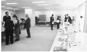
推奨土産品の審査会

市観光協会では、市内で製造または加工された土産品の普及と品質の向上を図り、市内における産業の振興に寄与することを目的に、推奨土産品を認定しています。推奨土産品に認定された商品は、観光パンフレットでPRする他、市観光協会の主催・後援のイベントや市観光協会が出店するイベントなどで販売することができます。お店の自慢の商品を出品しませんか？