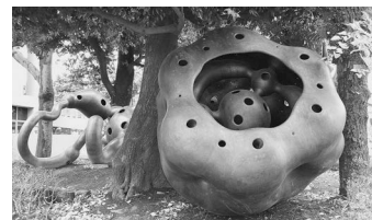
果実の中の木もれ陽