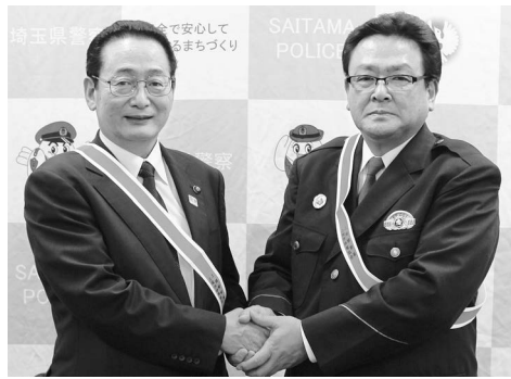
反射材の着用をお願いします(市長と上尾警察署長)

トを反射して強く光るので、「夕暮れ時から夜間」でも抜群に目立ちます。早朝・夜間のランニングや散歩時に着用し、効果をアピールしていただけるよう、上尾シティマラソンに参加される高齢者や、スポーツ講演会の参加者などに配布することにしました。