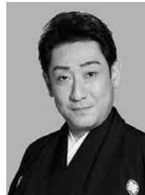
橋之助改め 中村芝翫