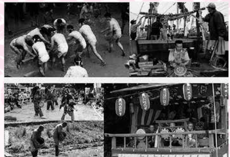
ホームページ(イメージ)

あげお文化遺産ガイド「無形文化遺産編」(☎ http://www.ageobunkaisan.jp ) ※市ホームページからもアクセスできます。