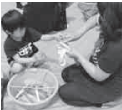
わくわく工作(藍染め)