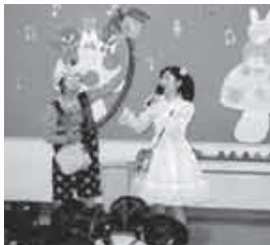
ゆかいなコンサート