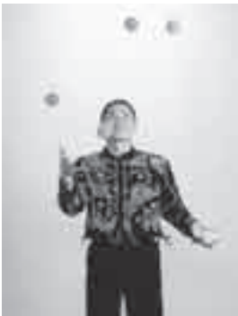
ジャグリングショー