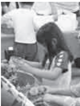
カーネーションの寄せ植え