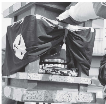
写真1 お獅子様(熊谷市小江川)