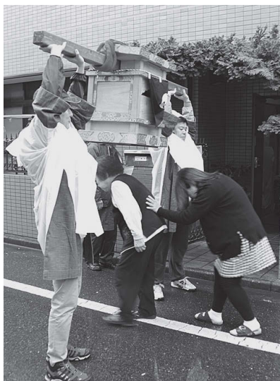
写真2 お獅子様の下をくぐると、無病息災の御利益があるといわれている(東京都北区浮間)

市域の西端、平方に鎮座する八枝神社は、「お獅子様」の神社として広範な地域から信仰を集めてきた。「お獅子様」とは、毎年2月から5月にかけて、悪疫退散を目的に、神輿に「獅子頭」を納めて貸し出し(写真1)、地域を祓って回る行事である。お獅子様は、正式には「狛狗大神」と呼ばれ、八枝神社の御眷属(神の使い)とされている。 お獅子様の起源や由緒については明確な資料はないが、確認ができる最も古い物として、八枝神社文書に「千座護摩募縁誌」の記述がある。これには、天保13(1842)年に八枝神社の前身であった正覚寺からお獅子様を迎えて「厄災消除」を祈念したと書かれており、江戸時代にはすでにお獅子様の行事があったことが分かる。 お獅子様の行事の最盛期である大正時代末から昭和初期には、埼玉県内から東京都内にかけて、年間約170の地域に貸し出しが行われた。当時は、リレーの要領で地域から地域へと受け渡す「巡廻」という方法で遠く離れた地域にも貸し出された。この巡廻には、大きく分けて六つの経路があったことが分かっている。中でも「蔵・東京方面」と「入間・多摩地区方面」の巡廻