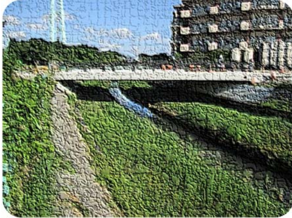
しばかわ よしのはし 芝川 吉野橋