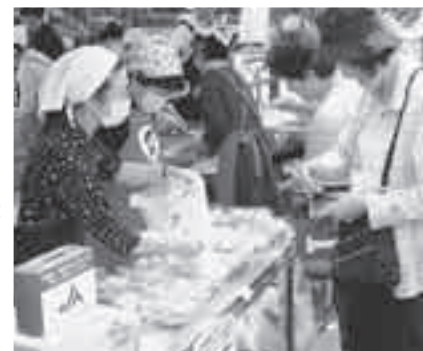
あげお花しょうぶ祭りで「手作りまんじゅう」を販売するJAあだち野女性部