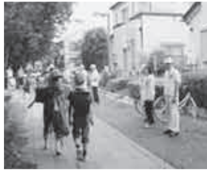
大石北小校門前であいさつ運動を行う防犯ボランティア

●泉鳳会(詩吟) 毎月第1・3木曜日午後1時～3時30分、上尾公民館 月額2,000円 石川☑725-8748 ☑ひと言! 古今の名詩を楽しく吟じて元気いっぱい。初心者大歓迎です。