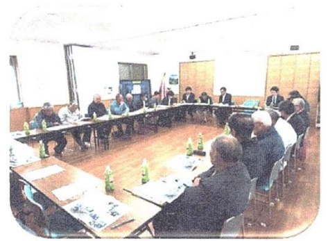
▲当日様子(設立総会後の第1回協議会)

昨春より当地区の住環境改善について上尾市と協議を重ね、昨年12月に実施したアンケートでは多くの皆様の賛意を得、そして市より正式に認定を受け、10月25日(水)午前10時より、地頭方公民館にて『地頭方地区街づくり協議会設立総会』を開催する事が出来ました。