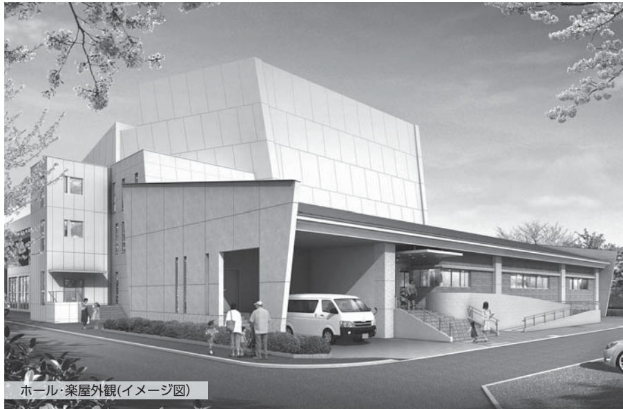
ホール・楽屋外観(イメージ図)