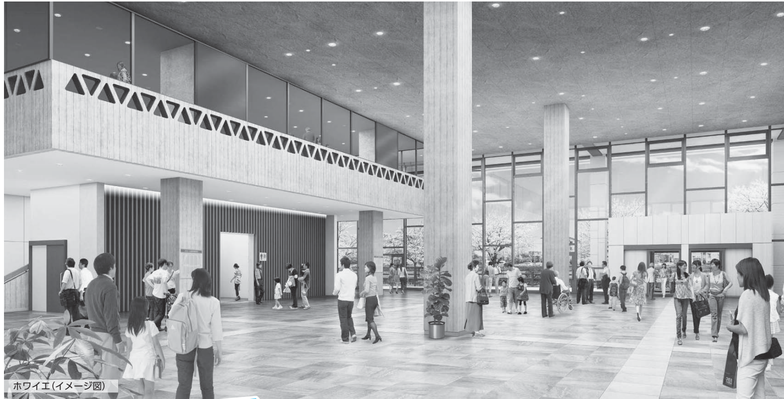
ホワイエ(イメージ図)