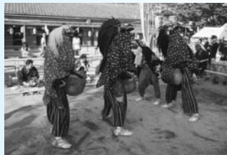
昨年の「藤波のささら獅子舞」

「藤波のささら獅子舞」は、江戸時代から伝承されている民俗芸能です。4人一組で演じられ、クライマックスでは、隠れてしまった女の獅子を2匹の男の獅子(雄獅子・中獅子)が争いながら見つける「雌獅子隠し」が演じられます。前夜祭にも、ぜひお越しください。 10月1日(日)13時～、17時～、20時～(3回上演、雨天決行) 13時～/密蔵院(藤波二丁目)、17・20時～/天神社(藤波一丁目) 【交通】JR上尾駅西口から“ぐるっとくん”で「ふじ学園入口」または「藤波公民館」下車 ※経路しない便がありますので注意してください。