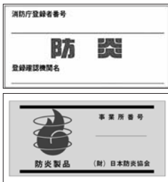
防災性能を示すマーク

一定の防災性能を持つ製品には、マークが付いていますので、購入する際の目安にしてください。