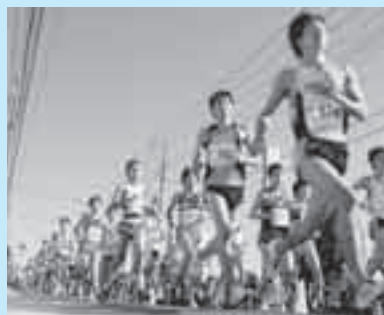
昨年の上尾シティマラソン

[問い合わせ先] 申し込み 2010上尾シティマラソンエントリーセンター(〒362-0003菅谷1-49テクノプラン株、☎778-5888)(月～金曜日(祝日を除く)午前10時～午後6時) スポーツエントリー http://www.sportsentry.ne.jp/ 大会内容 大会事務局(スポーツ振興センター内)(〒362-0045向山4-3-10、☎781-8112・☎781-8113)(月～金曜日(祝日を除く)午前8時30分～午後5時15分)