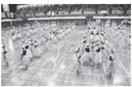
ことしの第52回市民体育祭に出演した市フォークダンス連盟

①臨時教員採用申込書②クラブ活動・部活動・ボランティア活動などの記録③教員免許状の写しまたは免許状取得見込証明書 ※①②は学務課にあります(HPからダウンロード可)。 ↓学務課(☎775-5960 4・☎775-5633)