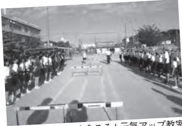
ようこそ!元気アップ教室

毎年、小中連携の一環として、中学生による陸上教室「ようこそ!元気アップ教室」を開催しています。また、逆上がりなどの確実な技能の定着を目指し、体育委員会の児童と教員で鉄棒キャンペーンを行っています。