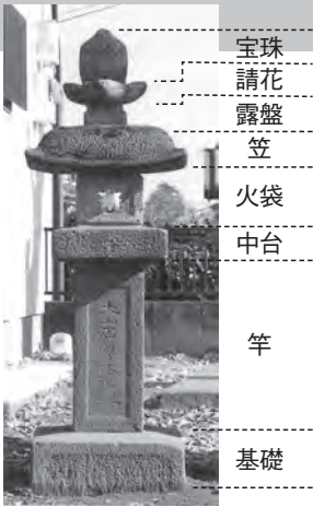
諏訪神社の石灯籠