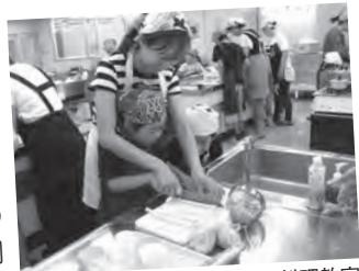
夏休み親子料理教室

アイデアおにぎりコンテスト・親子料理教室・お弁当の日など、家庭と連携して児童が食に対する興味・関心が持てるような取り組みを推進しています。アレルギー対応では、教職員の研修や面談などで、共通理解を図り、事故防止に努めています。