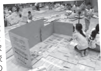
おやじの会主催の防災キャンプ

毎年、「おやじの会」主催で1泊2日の防災キャンプを開催しています。消火訓練をしたり、体育館に泊まったりして防災の学習をします。また、こども110番の家を回るスタンプラリーなど、学校と地域が連携して児童の安全の確保に努めています。