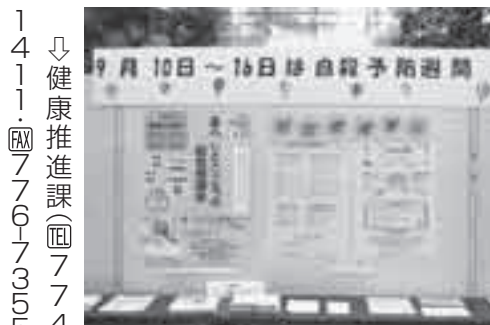
↓健康推進課(☎774-1411・☎776-7355) 昨年の啓発活動(市役所1階ロビー)