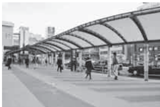
●歩行者用屋根を設置した西口広場