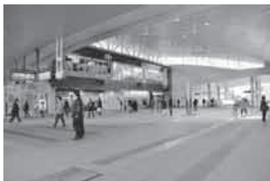
●自然の光を取り入れた東西を結ぶ自由通路