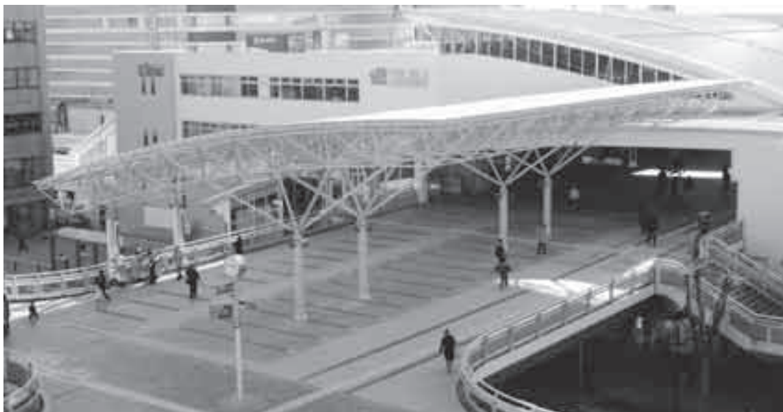
▲従来の8mから20mの2.5倍に拡幅した東口ペデストリアンデッキ