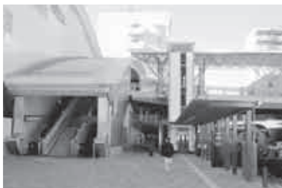
■駅近く(東口)に設置したエレベーター(中央)とエスカレーター(左)