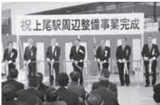
完成を祝い、テープカットをする島村市長(中央)ら