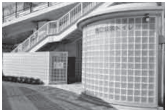
◎オストメイト(※注)対応多機能トイレを併設した西口トイレ