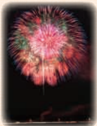
7月 あげお花火大会