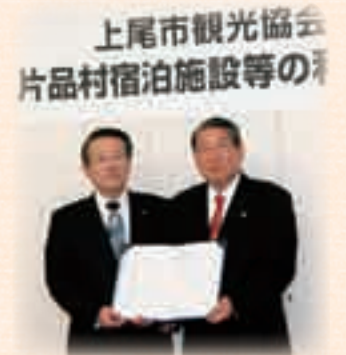
4月 市と片品村それぞれの観光協会が「片品村宿泊施設等の利用に関する協定」締結