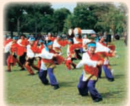
9月 あげお元気祭り