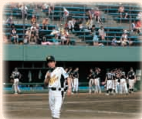
8月 欽ちゃんリーグ ゴールデンチャレンジ2010公式戦