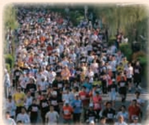
11月 2010上尾シティマラソン