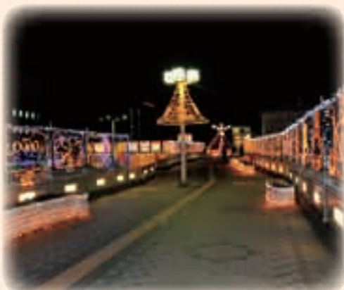
12月 2010あげおイルミネーション