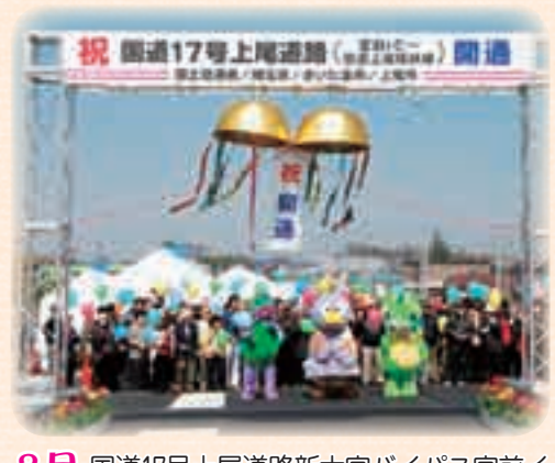
3月 国道17号上尾道路新大宮バイパス宮前インターチェンジから県道上尾環状線までが開通