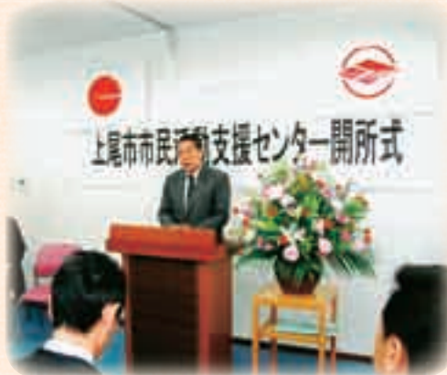
5月 市民活動支援センター開所