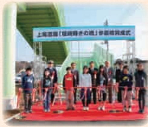
2月 堤崎地区の国道17号上尾道路に架かる歩道橋完成