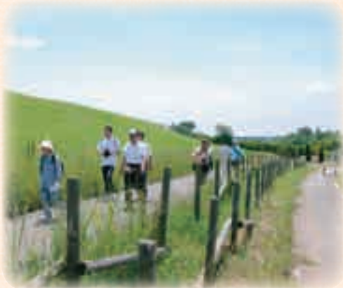
6月 あげお駅からハイキング