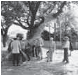
木に掛けた大縄をなう川地区の皆さん(平成20年)