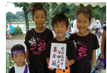
【復興支援の募金箱】

あいさつ。2人のカウントダウンで祭りがスタートし、関東地方を中心としたYOSAKOI32チーム、太鼓9チームが華麗な衣装に身を包み、公園内のあちこちでパワフルな舞、太鼓を披露しました。