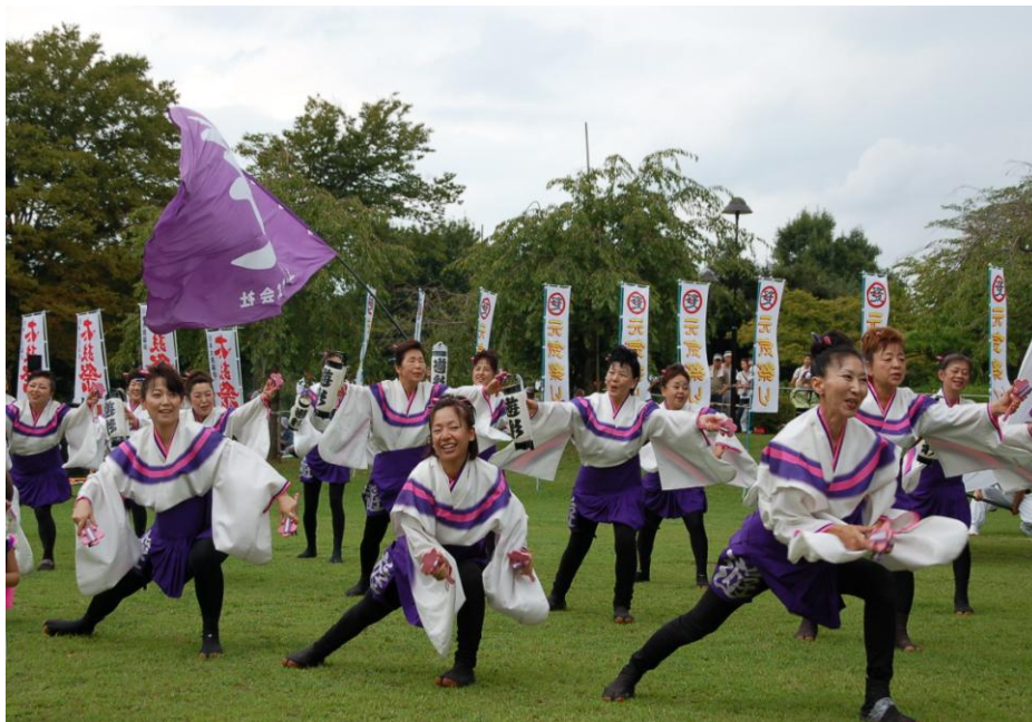
【YOSAKOIソーランを披露するあげお遊憂彩彩】

今年度の「協働のまちづくり推進モデル事業」に採択された団体の活動を順番に紹介します。