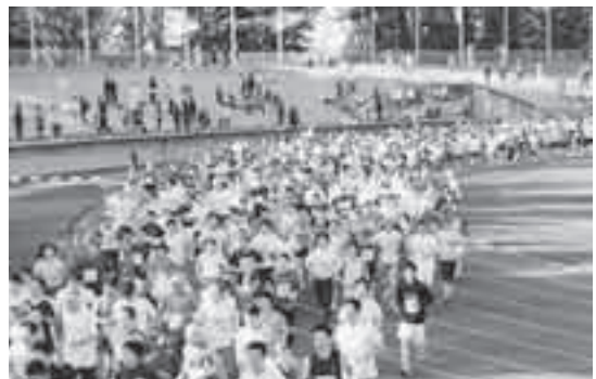
昨年の上尾シティマラソン