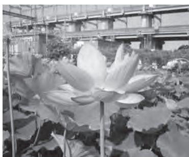
開花した原市沼周辺のハスの花

原市沼周辺のハスの花が見頃を迎えています。 時8月15日(月)までの6〜16時 ※開花の見頃は6〜9時です。 所原市沼周辺の蓮池 ※ニューシャトル(埼玉新都心交通)沼南駅から徒歩5分です。 岡飯坂☎774-8094・☎nikakayj@sirius.ocn.ne.jp