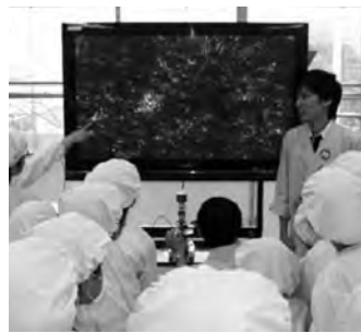
顕微鏡を使った乳酸菌の観察

市内に在住の小学4～6年生 費100円 定20人(応募者多数の場合は抽選) 申往復はがき(1人1枚)に住所、氏名(ふりがな)、性別、学校名、学年、保護者氏名、電話番号を記入して、7月11日(月)まで(必着)に消費生活センター(〒362-0075 柏座4-2-3)へ 岡消費生活センター 岡75-0800・岡76-4600