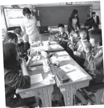
歯医者さんの仕事を体験

また、学校歯科医の先生が来校し、歯みがき指導をしていただいています。この前の指導では、矯正の時の型とりの体験や自分の歯型が分かるシートを作る体験をしました。自分の歯がどうなっているのかが分かり、これからも歯を大切にしていこうと思えました。これからもみんなで歯みがきを続けていきます。