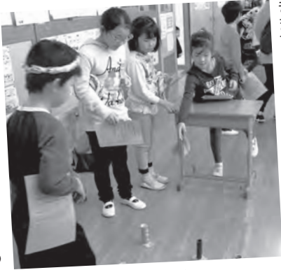
他の学年と楽しくゲーム

尾山台小学校には、異学年交流タイムがあり、1年生から6年生がみんなできつかの班に分かれて、交流を深めています。それぞれの班でいろいろな遊びをすることで、違う学年の友達同士、仲良くしたり、協力の大切さを知ったりすることができま