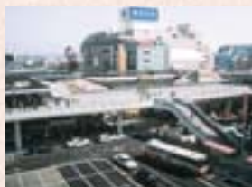
■平成7年2月 上尾駅西口デッキ開通