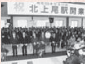
■平成63年12月 JR高崎線北上尾駅開業