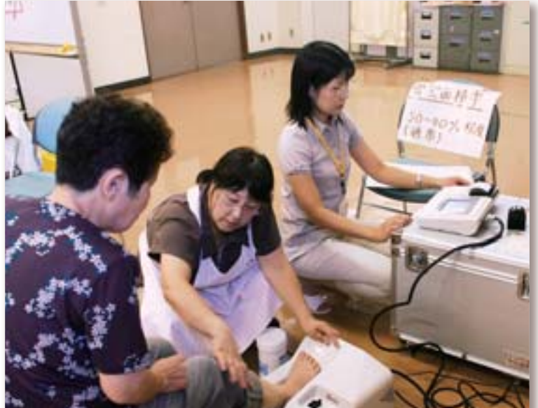
保健センターの活動 市民の健康を守り、疾病を未然に防ぐため、さまざまなセミナーが行われています。

市 民一人一人が安心感に包まれながら健康に暮らせることの重要性は、社会的にも非常に高まっています。 そのため、市民の健康を支える保健サービスや、市民の自発的な健康づくりを進める各種施策の充実に努めます。また、安心を届けるために、医療の充実に図り、とりわけ小児二次救急の充実に取り組めます。 安心・安全な市民生活のためには、災害に対する安全確保や防犯対策も大変重要です。地域コミュニティ活動などをベースとした防災・防犯体制の強化、災害時の拠点となる施設の耐震化などの整備と住民への周知、市民・企業・行政が相互に連携したシステムづくりなどを、総合的に進めていきます。