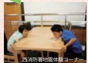
西消防署地震体験コーナー