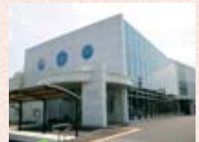
平成19年12月 西消防署複合施設が落成

医療施設数・病床数・医師数ともに大きく増加し、50年間で医療が充実してきたことがよくわかります。一方で、助産所数は1/3になりました。