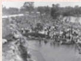
■昭和53年5月 上尾丸山公園オープン