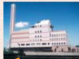
■平成10年1月 新西貝環境センターが稼働

※工業は、従業員4人以上の事業所(昭和31年) ※商業は、昭和29年と平成16年