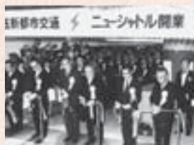
■昭和58年12月 新交通システム開業