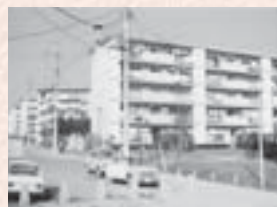
■昭和43年12月 西上尾第 団地入居開始