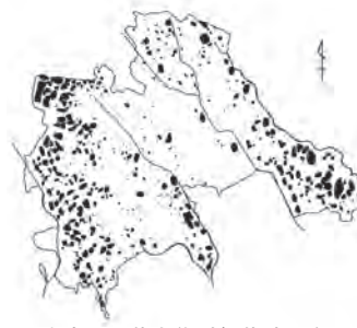
市内の埋蔵文化財包蔵地分布図

旧石器時代から近世に及ぶわが国の歴史を証明する国民共有の貴重な財産です。そのため、文化財保護法により保存の対象になっています。市内には約40カ所の埋蔵文化財包蔵地(遺構・遺物が埋まっている地域)があり(下図参照)、県に登録されています。包蔵地内で土木工事などを行う場合は「埋蔵文化財発掘の届出」が義務付けられています。次の①～③に該当する場合は、生涯学習課で確認してください。①農業基盤工事や造成工事などによる掘削が埋蔵文化財に及ぶとき②住宅などの恒久的な建物、道路その他の工造物を設置するとき③盛土または一時的な工造物の設置により、埋蔵文化財に影響を及ぼす恐れがあるとき