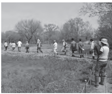
サクラソウトラスト地のお花見の様子

①身代り ②自然観察 ③三ツ又沼ビオトープ ④三ツ又沼ビオトープ ⑤三ツ又沼ビオトープ ⑥三ツ又沼ビオトープ ⑦三ツ又沼ビオトープ ⑧三ツ又沼ビオトープ ⑨三ツ又沼ビオトープ ⑩三ツ又沼ビオトープ ⑪三ツ又沼ビオトープ ⑫三ツ又沼ビオトープ ⑬三ツ又沼ビオトープ ⑭三ツ又沼ビオトープ ⑮三ツ又沼ビオトープ ⑯三ツ又沼ビオトープ ⑰三ツ又沼ビオトープ ⑱三ツ又沼ビオトープ ⑲三ツ又沼ビオトープ ⑳三ツ又沼ビオトープ ㉑三ツ又沼ビオトープ ㉒三ツ又沼ビオトープ ㉓三ツ又沼ビオトープ ㉔三ツ又沼ビオトープ ㉕三ツ又沼ビオトープ ㉖三ツ又沼ビオトープ ㉗三ツ又沼ビオトープ ㉘三ツ又沼ビオトープ ㉙三ツ又沼ビオトープ ㉚三ツ又沼ビオトープ ㉛三ツ又沼ビオトープ ㉜三ツ又沼ビオトープ ㉝三ツ又沼ビオトープ ㉞三ツ又沼ビオトープ ㉟三ツ又沼ビオトープ ㊱三ツ又沼ビオトープ ㊲三ツ又沼ビオトープ ㊳三ツ又沼ビオトープ ㊴三ツ又沼ビオトープ ㊵三ツ又沼ビオトープ ㊶三ツ又沼ビオトープ ㊷三ツ又沼ビオトープ ㊸三ツ又沼ビオトープ ㊹三ツ又沼ビオトープ ㊺三ツ又沼ビオトープ