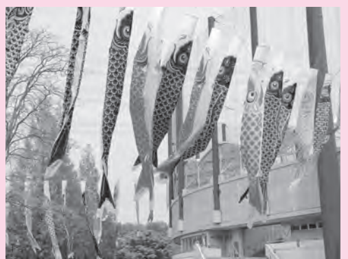
上平公園のこいのぼり

5月5日(祝)のこどもの日に合わせて、上平公園と上尾丸山公園にこいのぼりを掲揚しています。こいのぼりは市民の皆さんの寄贈によるものです。4歳以上の不用になったこいのぼりがありましたらお譲りください。【受付場所】市観光協会(上尾市プラザ22内) ※こいのぼりの寄贈は随時受け付けています。