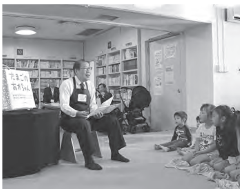
子どもたちに読み聞かせをする島村市長

新マニフェストでは、「市役所の改革」「子育て世代の応援」「子どもの教育の強化」「健康づくり支援」「便利な上尾への進化」「安全・安心の確保」「地域づくりとまちづくり」「賑わいの創出を大きな8つの柱に掲げ、市民一人一人が輝くまちづくりを積極的に推進していきます。中でも、次代を担う子どもたちに負担を残すことなく、輝く未来を贈るために、急務である