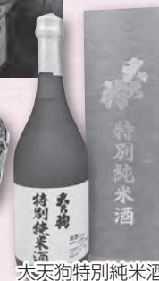
特別純米酒 大天狗特別純米酒

時とき 所ところ 内内容 対対象 費費用・金額 ※記載のないものは「無料」 定定員 持持ち物 申申し込み ※記載のないものは「当日、直接会場へ」 問問い合わせ