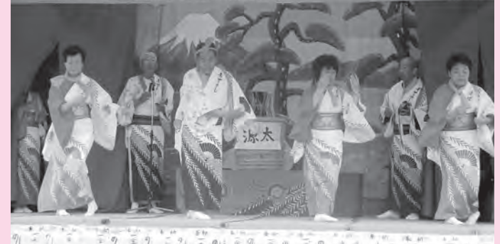
昨年の畔吉の万作踊り