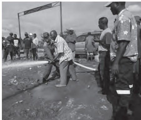
コンゴ民主共和国での技術指導

(一社)日本外交協会の国際援助・協力事業の一環として、コンゴ民主共和国に廃車予定だった市の水槽付消防ポンプ自動車を提供しました。それに伴い、平成27年11月29日～12月12日に、東消防署の職員を車両操作などの技術指導員として派遣しました。