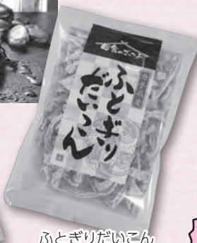
ふとぎりだいこん