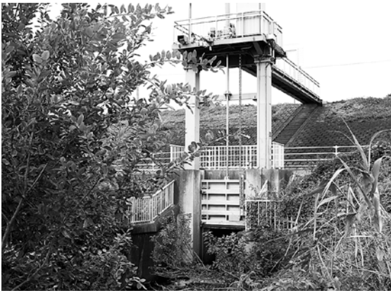
江川の水門 (宮下樋管)

しまった。江川の氾濫を抑えるために、この水門の箇所には排水ポンプを設置して水を流すことは有効な手段と考えるが、市の見解を伺いたい。