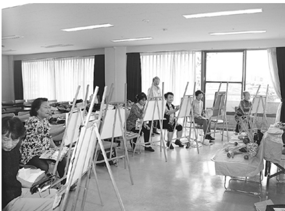
上尾公民館講座室での活動の様子