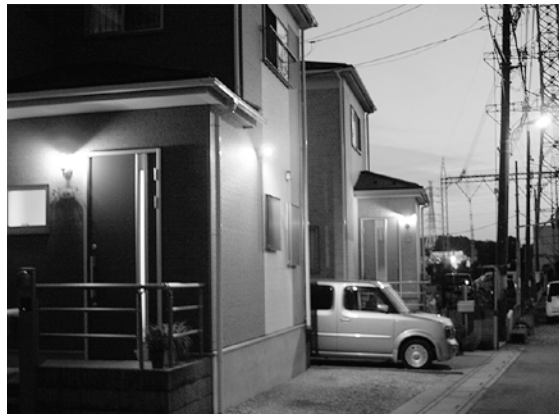
陣屋地区の「一戸一灯運動」の灯