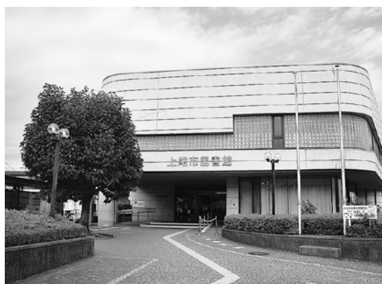
現在の上尾市図書館本館

30〜35 億円と試算している。 〜その他の質問〜 ・イオンモール出店について ・芝川の浸水対策について