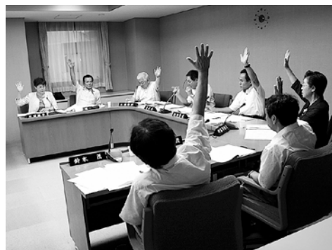
▲総務常任委員会の様子