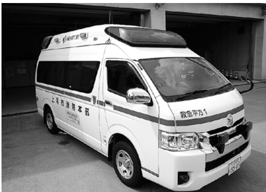
高規格救急自動車