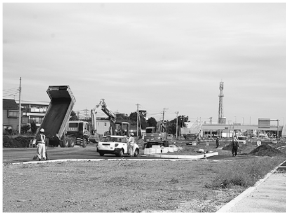
開通に向け工事が進む上尾道路

は市内に7団体あり、上尾道路沿道で6団体、国道16号線沿道で1団体である。この事業は国道事務所で行っており、資材提供も国道事務所が行っているため市が補助する予定はない。国道事務所では、現在、植樹帯の植栽計画を策定中とのことである。 ・ その他の質問 ・自主防災について