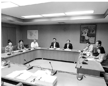
▲議会報編集委員会の様子