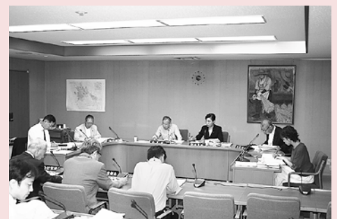
決算特別委員会の様子