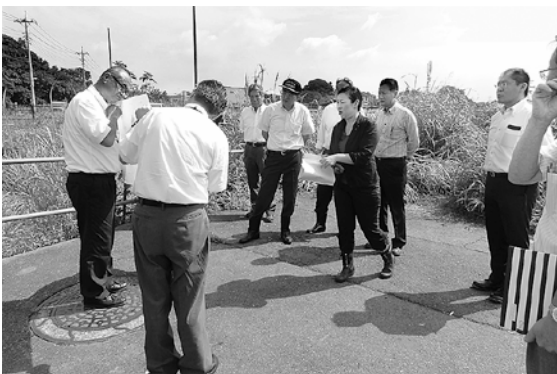
都市整備消防常任委員会現地調査の様子 (境橋建設工事場所)

答 橋に進入する道路には、大型車に対する規制があるが、新たな橋については、特に重量規制はかけない。