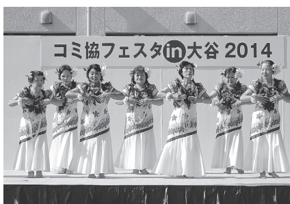
昨年のコミ協フェスタin大谷2014

時10月18日(日)9～15時(雨天の場合、一部の催しは中止) 所上尾市民体育館 所地元幼稚園児による交通安全パレード、バルーン遊戯、フリーマーケット、模擬店、郷土芸能(太鼓、箏曲、吹奏楽、アカペ