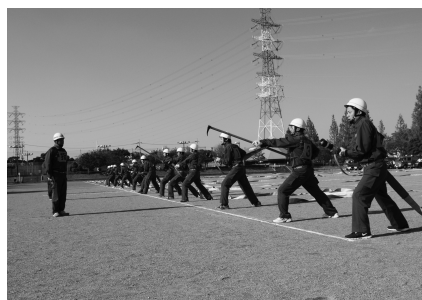
昨年の上尾・伊奈合同消防特別点検

時 10月25日(日)13時30分～16時(雨天中止) 所 上平公園多目的広場 園 消防職・団員による訓練礼式、機械器具点検、ポンプ車操法訓練展示、消防署訓練展示、表彰伝達式、消防音楽隊による演奏 園 消防総務課 ☎75-1500・FAX75-2230