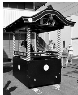
宝くじ助成で購入した山車

上宿区・地頭方自治会／集会所備品(テーブル他) 泉台区会／山車他 〇市民協働推進課 〇75-4539・〇75-9819