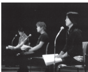
劇団東京ルネッサンス