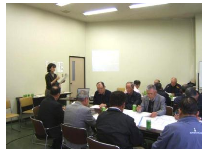
街づくり専門家の派遣