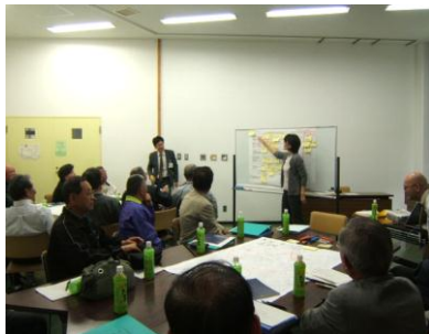
協議会活動の様子（H23）