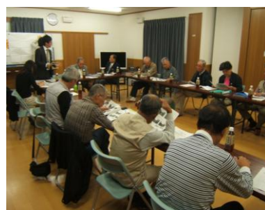
協議会活動の様子（H24）