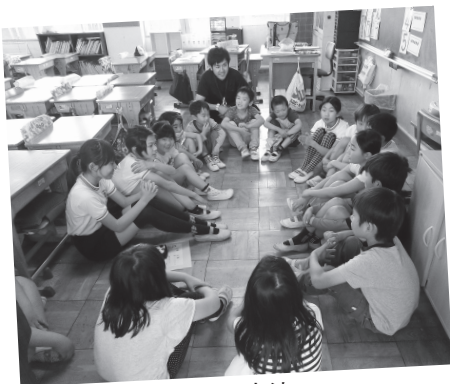
縦割り班で他学年と交流

ことしから、1年生から6年生までの縦割り班を編成しました。運動会などの学校行事をはじめ、遊びや給食などで縦割り班活動を行っています。優しさや責任感を身に付けたい6年生が、活動を通して「輝く姿」を見せることにより、下級生に「自分も」というあこがれを抱いてほしいと思っています。