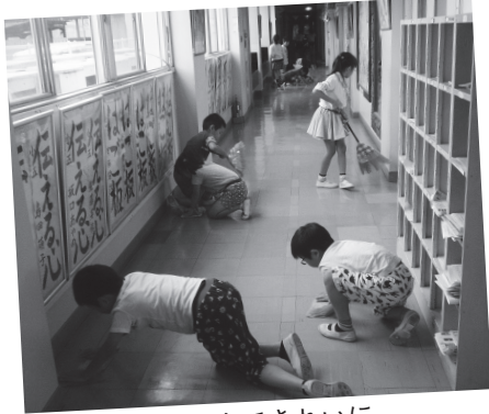
無言清掃で隅々まできれいに

学校のマナーアップの一つとして、「無言清掃」に取り組んでいます。無言で清掃をすることで集中して取り組むことができ、隅々まで目が行き届いてきれいにするのができます。これからもぜひ続けていきたいです。