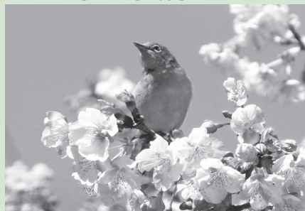
『河津桜とメジロ』 気ままな旅人さん(上尾市)の作品