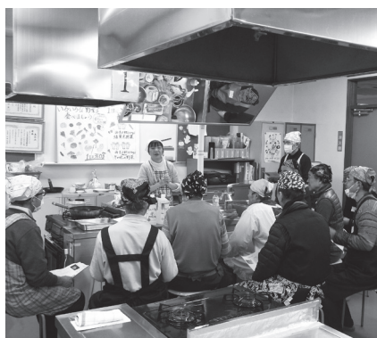
昨年の高齢者向け料理教室