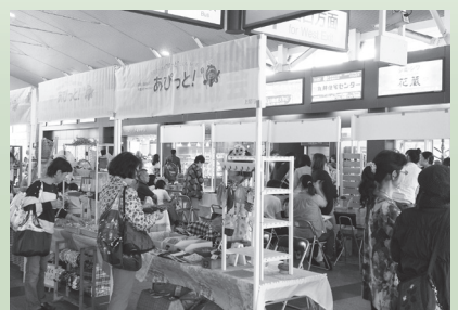
昨年のあびっと! マルシェの様子

市内のハンドメイド作家が自身の作品を展示販売します。布小物・雑貨・アートフラワー・アクセサリなど、世界に一つだけの作品が並びます。 時5月16日(土)10～16時 所JR上尾駅自由通路