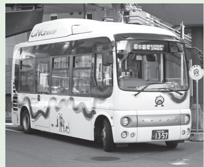
市内循環バス“ぐるっとくん”

市内循環バス“ぐるっとくん”のバス停に名称を付ける権利(ネーミングライツ)を購入するネーミングライツパートナーを募集します。【募集期間】5月7日(木)～27日(火) 【名称の設定期間】10月1日から5年間 【パートナー料】12万円(年額) 【応募方法】申請書(交通防犯課にある。市ホームページからダウンロードも可)に必要事項を記入して、必要書類を添付し直接、交通防犯課へ ※詳しくは募集要項(交通防犯課にある。市ホームページからダウンロードも可)をご覧ください。