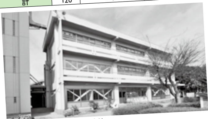
耐震補強された中央小南校舎東棟