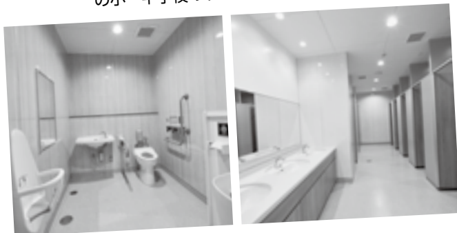
改修された中央小のトイレ