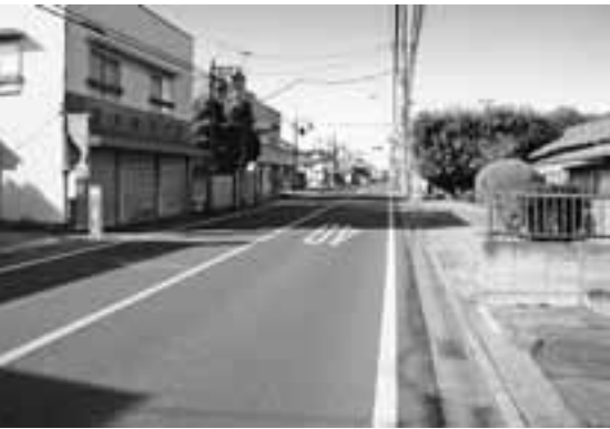
写真2 写真1と同じ場所の現在の様子

上尾市の東部を南北に縦断するさいたま菖蒲線(旧道)は、古くから「菖蒲往還」と呼ばれる主要な道であった。さいたま市方面から菖蒲往還の両側に町並みが続き、朝日バスのバス停「下新町」の辺りから、「ぐるっとくんのバス停」上野町付近までが原市の町場として栄えていた。ただし「原市」は江戸時代になつてからの地名であり、それまでは「原宿」と呼ばれていた。 さいたま市北区吉野町は、かつては吉野原村といい、現在の原市地域も含まれていた。吉野原村を通る菖蒲往還沿いに宿場が形成され、吉野「原」村の「宿」として「原宿」と呼ばれた。その後、宿場の道沿いで市が立つようになり、吉野「原」村の「市」として「原市」と呼ばれるようになったという。 永禄十(1567)年9月、北条家印判状(平林寺文書)では、原宿の代官職を平林寺の泰翁宗安に命じたとあり、同年12