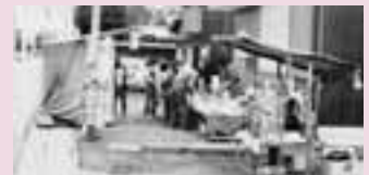
写真2 雛市(昭和51年撮影)