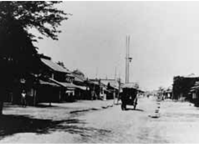
写真1 明治時代の原市の街並み。写真中央に馬車が見られる(1908年撮影)