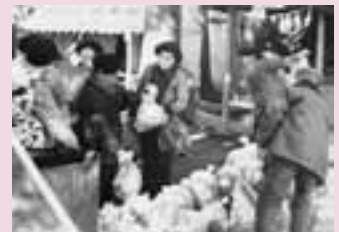
写真1 だるま市(昭和51年撮影)

3・5月の節句の前には、雛市も開かれていた(写真2)。地元商人の他にも、人形の町として有名な岩槻や鴻巣からも人形屋が出店していた。しかし、戦後になると縮小されていき、昭和35年頃からは人形屋が出店しない雛市となった。金魚屋が多く出店した時期には「金魚市」、植木中心になったときには「植木市」と、呼び名を変えていった雛市は、庭を紅白の幕で囲って飾り、とても華やかであったという。