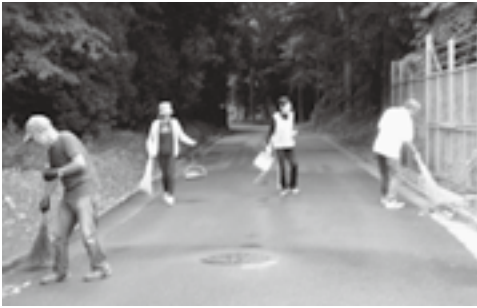
地域を自分たちできれいに

道路などの環境美化を実施する主な活動として、市が主催する5月30日(土)～(5)み(3)ゼロ(0)の前後に行われる「クリーン上尾運動」、上野地区が主催する7月中旬の「小枝切り」、12月中旬に行わ