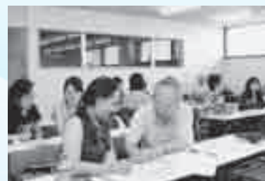
和やかな雰囲気日本語教室

市内在住のロシアの人から母国の言葉、暮らしなどの話を聞いたり、料理を一緒に作ったりします。日本とは異なる文化に触れてみませんか。申し込み方法など詳しくは暮らし・彩り・公民館(27ページ)をご覧ください。 ☎上尾公民館☎775-0185・☎776-7366