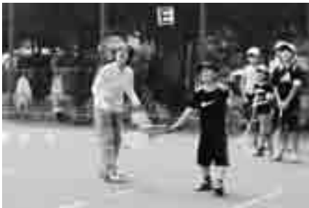
ジュニアソフトテニス教室(昨年)

【時】7月19日(土)～23日(水)9時～11時30分(全5回) ※予備日は24・25日です。 【所】市民体育館 【関】市内に在住の小学生 【費】2千円(初日に集金) 【定】100人 【関】ラケット(持っている人)、テニスシューズ 【申往復】はがきに住所、氏名(ふりがな)、学校名、学年、性別、電話番号を記入して、6月30日(月)まで(必着)に市民体育館(〒362-0045 向山4-3-10)へ 【問】上尾市民体育館 ☎781111・☎7818113