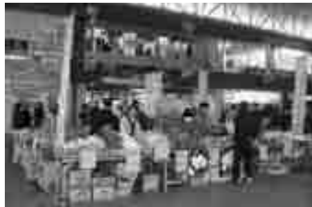
さまざまな農産物が並ぶ

日本大震災の被災地産の農産物など(青果・豆腐)の販売 関 上尾商工会議所 075-3111・075-9090