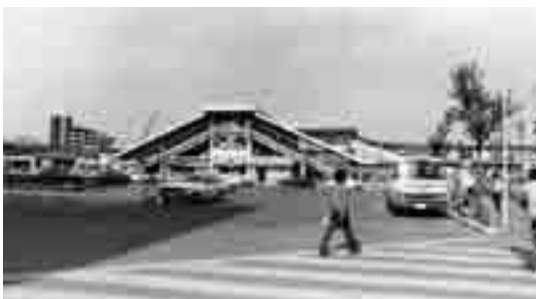
昭和57年のJR上尾駅西口(展示予定写真の一部)

時 6月18日(水)～22日(日)9～17時(22日は15時まで) 所 コミュニティセンター展示ロビー 関 上尾市内の街並みの写真(主に昭和)の展示 関 上尾市コミュニティセンター 075-0866・075-0868