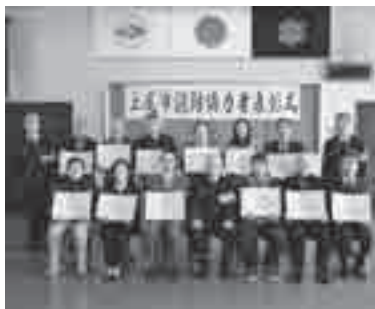
消防協力者の皆さん