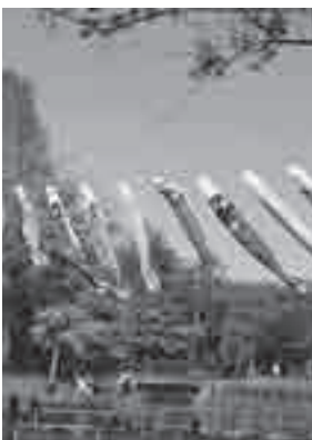
上尾丸山公園に掲げたこいのぼり(昨年)