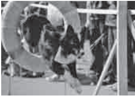
昨年のAI♡犬フェスティバル

▼とき 10月19日(土)午前9時30分〜午後3時30分 ▼ところ 上平公園 ▼内容 犬のしつけ方教室(愛犬との参加は事前登録者だけ。見学は自由)、動物由来感染症教室(動物から人につく病気を)、犬法律教室、犬猫健康相談、ふれあい広場、犬の譲渡会、動物防災コーナー、優良飼い主表彰、フードプレゼンテーション他