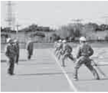
昨年の上尾・伊奈合同消防特別点検

▼とき 10月20日(日)午後1時30分〜4時(雨天中止) ▼ところ 上平公園多目的広場 ▼内容 消防職・団員による訓練礼式、機械器具点検、ポンプ車操法訓練展示、消防署訓練展示、表彰伝達式、消防音楽隊による演奏 ↓消防本部総務課(☎7751500・FAX77512230)