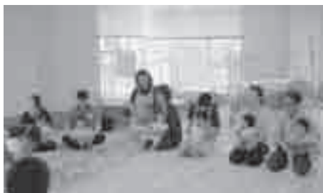
前回のふたご・みつごの子育て教室

▼乳幼児相談センター(☎776-6166・☎776-9127・☎51725000 city.ageo.jp)