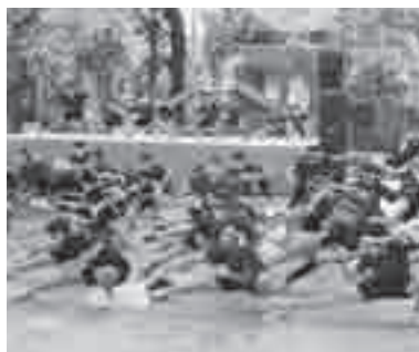
昨年のコミ協フェスタ in 大谷

▼とき 10月20日(日)午前9時～午後3時(雨天の場合輪投げ大会だけ実施) ▼ところ 上尾市民体育館 ▼内容 地元幼稚園児による交通安全パレード、バルーン遊戯、交通安全クイズ、フリーマーケット、模擬店、郷土芸能(囃子、民謡)、吹奏楽演奏、輪投げ大会など ↓コミ協フェスタ in 大谷2013実行委員会(大谷支所内、☎781-0121・☎780-1113)