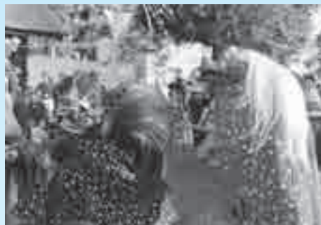
昨年の「藤波のささら獅子舞」