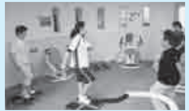
ラウンドフィットネス

初めてラウンドフィットネスをする人が対象です。有酸素運動(ウォーキング、ステップ)と筋力運動(マシン)を30秒ずつ交互に行います。※所要時間は30～45分程度です。