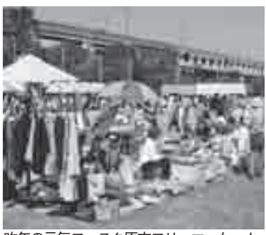
昨年元気フェスタ原市フリーマーケット

▼とき 10月20日(日)午前9時30分～午後2時30分 ▼ところ 原市小学校校庭(小雨の場合は新幹線高架下) ▼応募条件 ①代表者(18歳以上)が市内に在住か在勤の個人または団体(販売業の人を除く)②商品は家庭内の不用品・手作り品 ▼募集店数 50店(応募者多数の場合は抽選) ▼出店料 千円 ▼申し込み 往復はがきに代表者の住所、氏名、年齢、電話番号、販売品目を記入して、8月30日(金)まで(必着)に元気フェスタ原市2013実行委員会(〒362-0021原市3533原市支所内)へ ※後日、出店者説明会を行います。