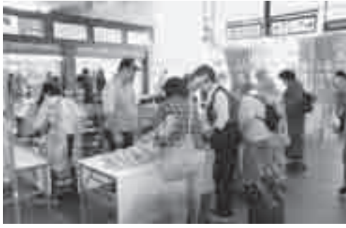
昨年のあげお朝市

▼とき 9月7日(土)午前9時～11時30分 ▼ところ JR上尾駅自由通路 ↓あげお朝市実行委員会(農政課内、☎77517384・☎77519872)