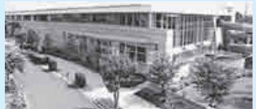
健康プラザわくわくランド

ご利用ください! 市内循環バス“ぐるっとくん”平方循環・東西循環で「わくわくランド」下車