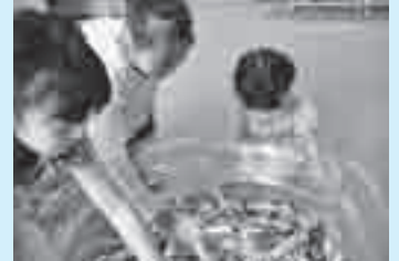
お菓子つかみ取り

▶とき 8月3日(土)午前10時～ ▶内容 お菓子つかみ取り、ヨーヨーすくい、スーパーボールすくい、お面販売など ▶参加費 無料 ※別途入館料が必要です。