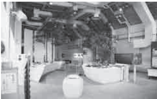
自然学習館路ロビー