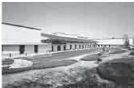
上尾伊奈斎場つつじ苑