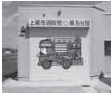
消防団第五分団車庫詰所

建物の老朽化のため建て替えていた上平地区の消防団第五分団の車庫詰所が3月22日に完成しました。今年度は新ポンプ車両の更新も予定されています。