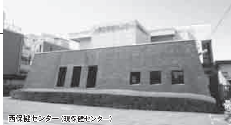
西保健センター(現保健センター)