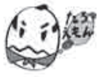
荒川太郎右衛門自然再生事業イメージキャラクター「たろうえもん」