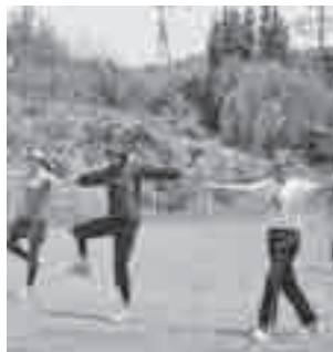
準備運動する参加者(昨年)

▼とき 6月1～15日の毎週土曜日(全3回・1コース) 午前9時30分～正午 ※最終日に交流会があります(午後2時ごろまでの予定、希望者だけ)。 ▼ところ 上尾市民体育館、ゆりが丘公園 ▼内容 ジョギング教室、ジョギングを通しての交流 ▼対象 市内に在住のジョギングに興味がある人 ▼定員 30人 ▼参加費 500円(保険代など) ▼持ち物 運動できる服装、運動靴、タオル、飲み物、帽子、着替え(必要な人) ▼申し込み 住所、氏名、生年月日、日中連絡のつく電話番号を電話またはファクス、メール(☎joglife@city.agoel.jp)で5月17日(金)まで(必着)に健康推進課へ ↓健康推進課(☎7741411・☎77617355)、市民体育館(☎7818111・☎7818113)