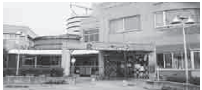
児童館アッピーランド

▶とき 5月28日、6月4・11・25日、7月2・9日(全6回) ▶定員 25組(先着順) ▶対象 2歳児以上 ▶申し込み 5月8日(水)午前9時から直接児童館アッピーランドへ