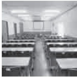
宝くじ助成金で購入したテーブルと椅子

(財)自治総合センターでは、コミュニティの健全な発展と宝くじの普及のため「コミュニティ助成事業」を実施しています。原市第七区では、平成24年度宝くじ助成を受けて、同区会館にテーブル、椅子、食器棚などの備品を整備しました。