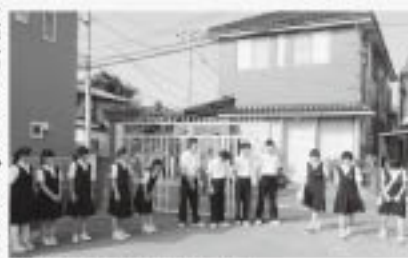
朝のあいさつ運動の様子

原市中学校の標語は、「頑張ることはカッコイイ」です。この標語を彫った石碑が正門を入ってすぐ正面にあり、原市中のシンボルになっています。