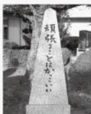
標語を彫った石碑

生徒のほとんどが部活動に参加しており、目標に向かって努力をしています。書道展や美術展、科展などでもたくさん生徒が表彰されています。このように、原市中では「頑張ることはカッコイイ」の標語どおりに勉強・部活・行事などさまざまなことに積極的に取り組んでいます。私たち生徒会は、みんなと協力して学校をよりよくしていこうと日々活動しています。