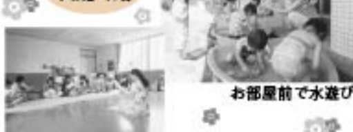
お部屋前で水遊び