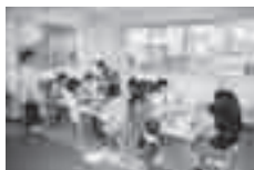
フラワーアレンジ講座

園庭解放(夏は水遊び)、身体測定、誕生会、救急法、親子体操、楽器遊び、親子リトミック、リズム遊び、作って遊ぼう、おしゃべりサロン、親子英語、英会話、フラワーアレンジ講座、料理講習会、歯科医・小児科医の話