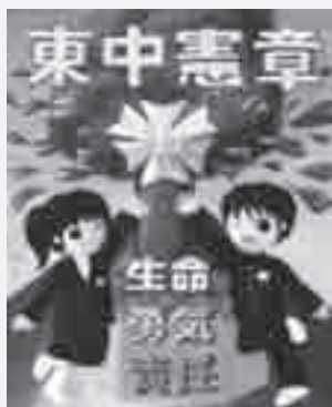
東中憲章のポスター

まずこの憲章を作るに当たり、全校生徒に「いじめ」「暴力」についてのアンケートを行いました。その後の中央委員会で繰り返し検討して、全校集会で全員一致で決定したものです。 私たちは先輩たちが作ったこの憲章を守り、そして次の代へと引き継いでいきます。