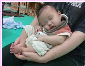
ママのおひざでぐっすりスヤスヤ…(3か月のYくん)