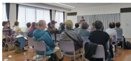
令和 7 年度 畔吉集会所人権問題指導者研修会

アンチエイジングコーラス～みんなで楽しく歌いましょう～、パドル体操で健康作り！！、初心者向けスマホ教室、夏休みこども歴史教室～縄文土器に触れてみよう～、キッズバランスボール、親子でクッキング～冷やし中華ははじめました～、基礎から学ぶフラダンス