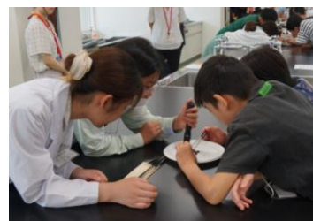
子ども大学あげお・いな・おけがわ

聖学院大学、日本薬科大学、上尾市教育委員会、伊奈町教育委員会、桶川市教育委員会で実行委員会を組織し、各市町の小学校5・6年生を対象とした講座を実施。