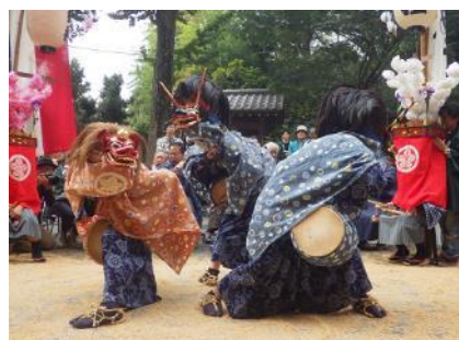
畔吉ささら獅子舞