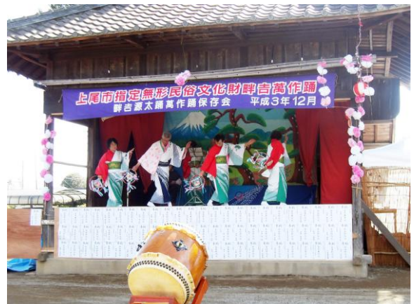
市指定無形民俗文化財「畔吉の万作踊り」