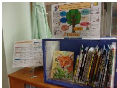
学校の授業をきっかけに読書が広がる本のセット（小学校向け）