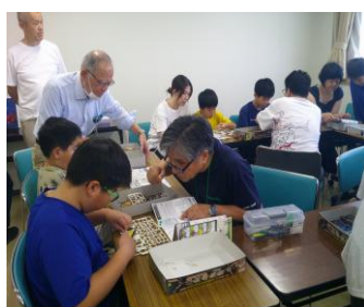
プラモデルを作ろう