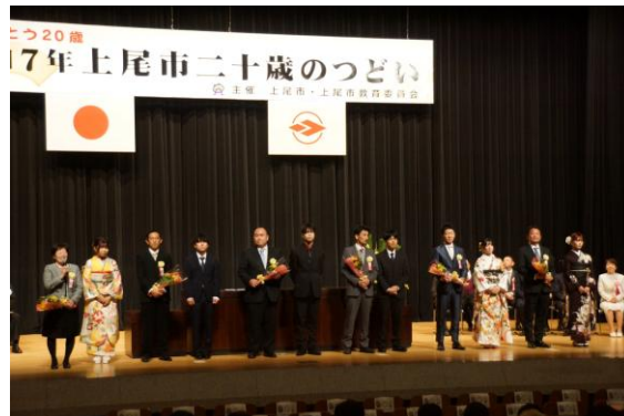
令和 7 年上尾市二十歳のつどい