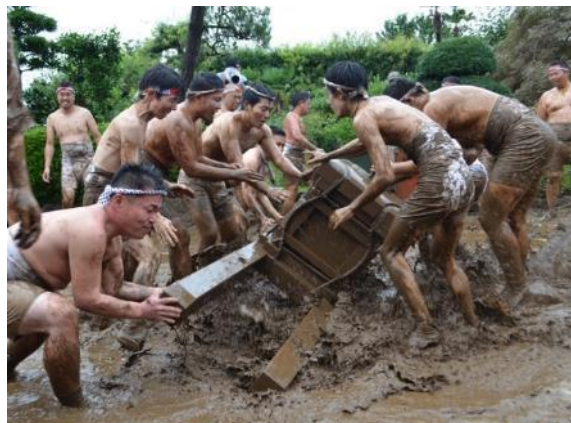
平方のどろいんぎょ