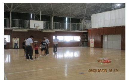
ドローン操縦体験教室