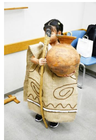
「夏休みこども考古学教室」