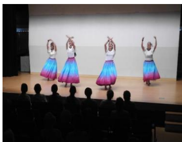
上尾公民館まつり