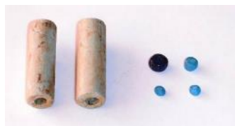
坂上遺跡方形周溝臺 出土品