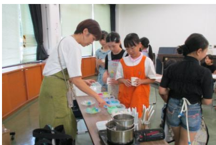
キラキラ宝石せっけんを作ろう