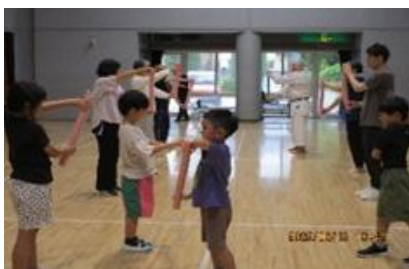
チャンバラごっこ