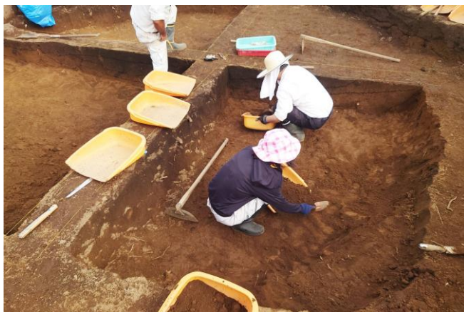
尾山台遺跡第4次発掘調査