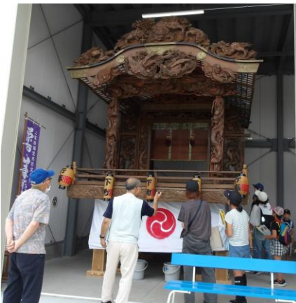
あげお歴史セミナー 「あげお歴史探検ツアー」