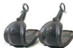
永楽通宝紋鞍 （付鐙一双）