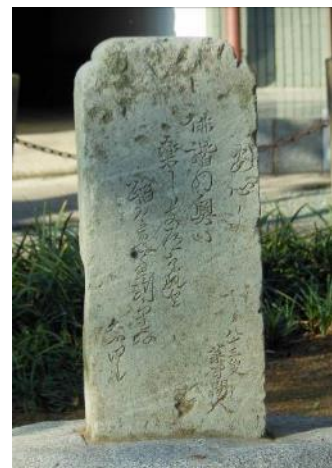
鈴木荘丹俳諧歌碑