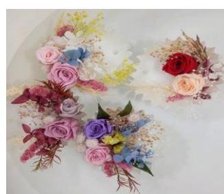
アロマワックスサシェ