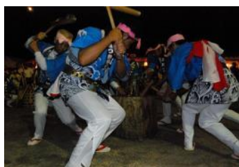
藤波の餅つき踊り