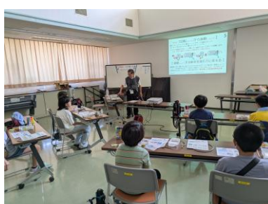
振動で動くロボットを作ろう