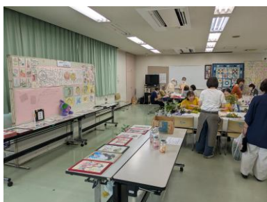
大石公民館まつり