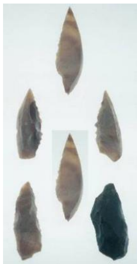
殿山遺跡出土旧石器