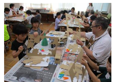
夏休みダンボールクラフト教室