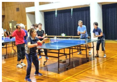
初心者向け卓球教室