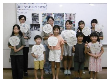
親子うちわ手作り教室