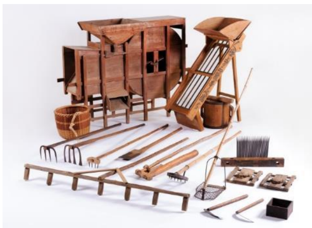
上尾の摘田・畑作用具