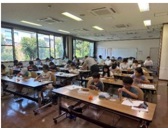
天然石を使って万華鏡を作ろう