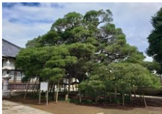
馬蹄寺のモクコク