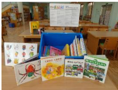
えほんあっぴいぶっくる (保育所向け)