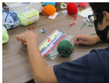
ネット手芸でペン立てを作ろう