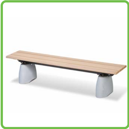
製品名：背なしベンチ 型番：MBR-18iF-P 総額：¥132,000 (税込み)