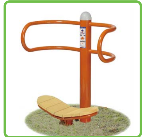
製品名：健康器具リズムボード 型番：FITR-15F 総額：¥660,000 (税込み)