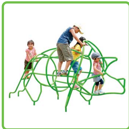
製品名：ジャングルジムトリケラ 型番：DN-TT2 総額：¥1,056,000 (税込み)