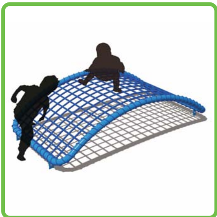
製品名：ころりんネット 型番：KDC-09 総額：¥550,000 (税込み)