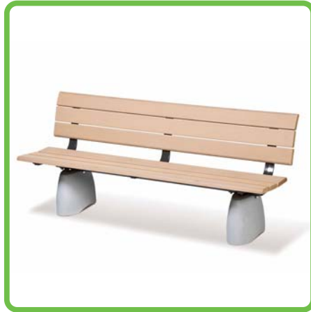
製品名：背つきベンチ 型番：MBR-18i-P 総額：¥190,300 (税込み)