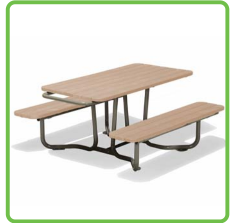
製品名：ピクニックテーブル 型番：YTR-U15V 総額：¥543,400 (税込み)