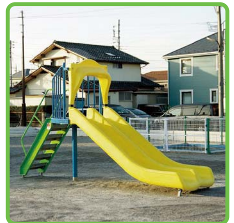
製品名：ダブルスライダー 1200 型番：SLW-12Y 総額：¥1,265,000 (税込み)