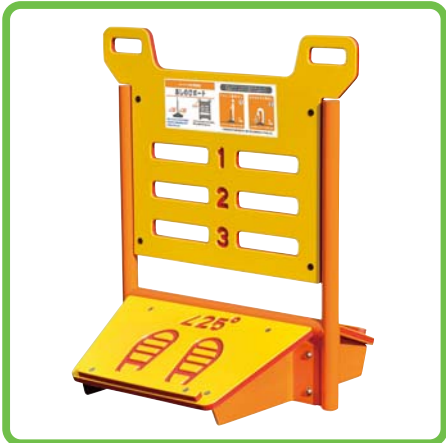
製品名：健康器具あしのびボード 型番：FIT-K05F 総額：¥385,000 (税込み)