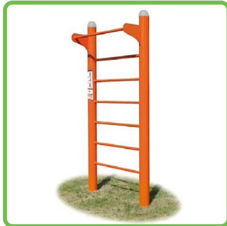
製品名：健康器具ウォールラダー 型番：FIT-04F 総額：¥462,000 (税込み)