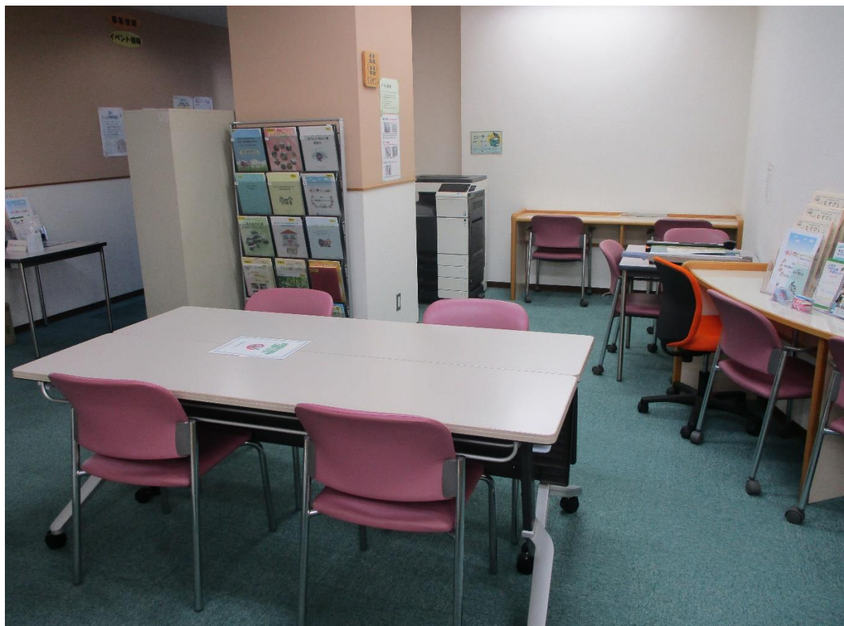
交流や打合せ用のオープンスペース